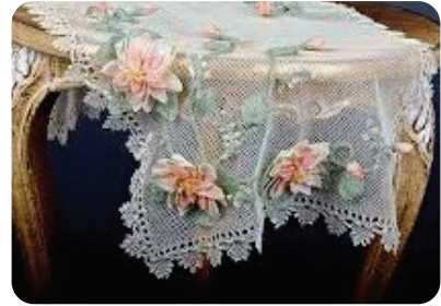
İğne Oyası Motifi

Dolaylı iletişim insanların iletişimde tercih ettiği yöntemlerden biridir. Günümüz insanı nasıl duygu ve düşüncelerini telefonlarındaki sembollerle ifade ediyorsa, Anadolu insanı da konuşmak yerine kendilerini renklerle, motiflerle ifade etmeyi tercih etmiştir. Bu yöntemlerden birisi de dünyada "Türk Danteli" olarak tanınan iğne oyasının motifleridir. Anadolu kadını oyalarla sadece başörtüsünü süslemez, onları âdeta birer sözsüz iletişim unsuru olarak kullanır. İğne oyasıyla sevgi, acı, pişmanlık, öfke, düş kırıklığı, mutluluk gibi duygularını dile getirir.